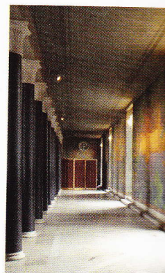
Stora galleriet, Stockholm